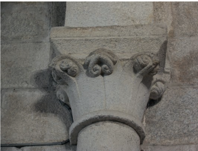
Capitel de las naves