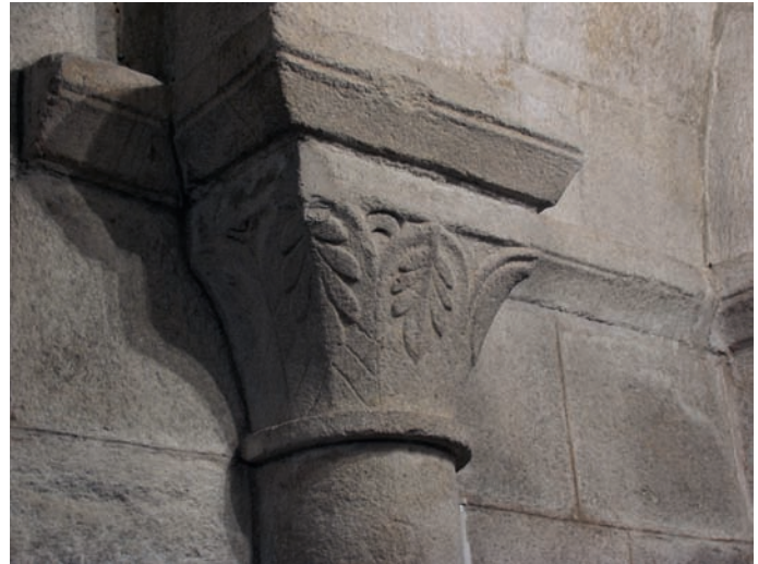
Capitel de la capilla norte