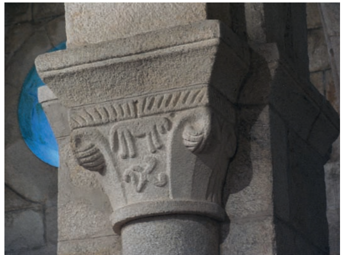
Capitel de las naves

rior, de mayores dimensiones, se corresponde en su totalidad con el soporte, y la superior está realizada en el mismo bloque pétreo que el capitel. Ambos capiteles responden al modelo empleado en el interior y en las columnas del cierre del ábside, con hojas apuntadas con pomas. Sobre ellos se sitúan cimacios en nacela ligeramente impostados.