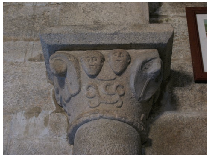
Capitel de las naves

En un documento de mediados del siglo XVII en el que se solicita la piedra del maltrecho campanario de Monteagudo para realizar la iglesia de los Agustinos de Caión, se indica que además del que estaba en uso en el momento "sabían y tenían por cierto y notorio que la torre y campanario que antes de ahora servía en dicha iglesia estaba junto de ella se había caído la mayor parte de una esquina (...) la torre vieja que había quedado está propicia a caer toda y amenaza gran ruina sobre de la capilla mayor". En