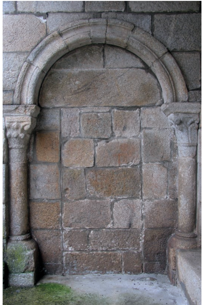
Portada del muro sur

Posee una planta basilical con tres naves, las laterales son muy estrechas, divididas en tres tramos de diferentes longitudes. La cabecera tiene tres ábsides semicirculares, el central de mayores dimensiones, precedidos de un tramo recto. Sin embargo en el trazado original el cuerpo de naves se planteó antecedido de un crucero no destacado en planta pero sí en cuanto a longitud. Ese crucero ahora se corresponde con el tramo inmediato a las capillas. La