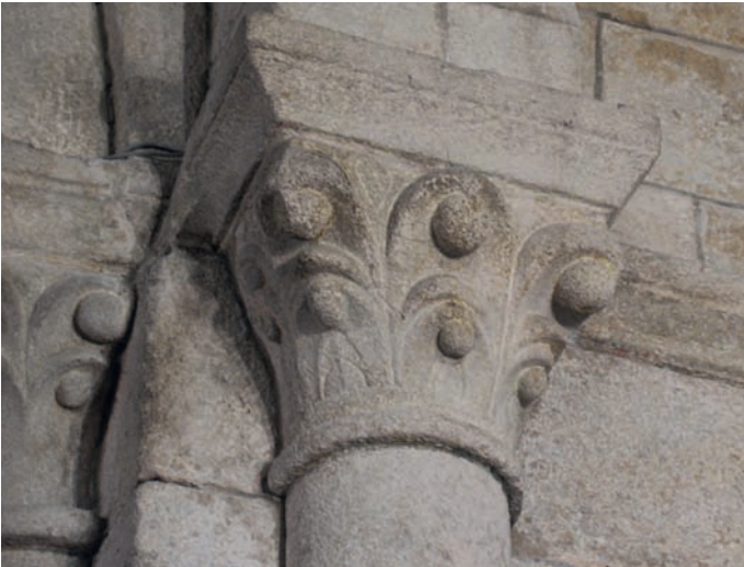
Capitel de la capilla mayor