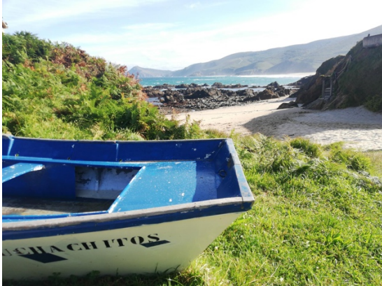
PRAIA DE SARTAÑA