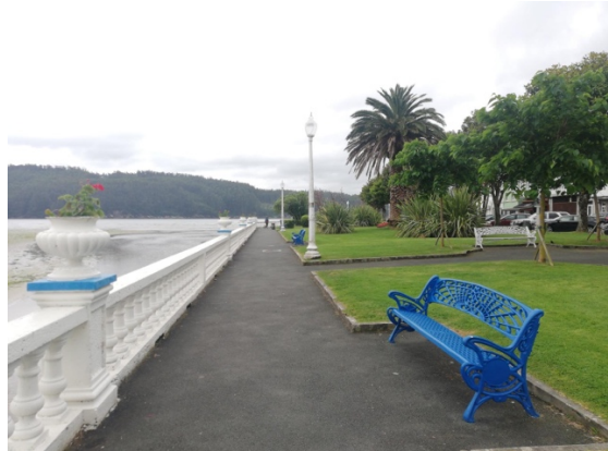
PASEO MARITIMO DE CEDEIRA