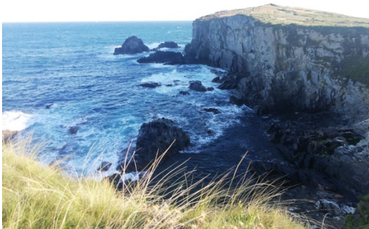
ACANTILADOS PUNTA FROUXEIRA.