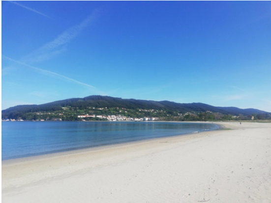
PRAIA DA MADALENA.