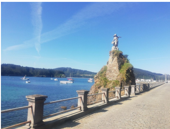
MONUMENTO MUJER DE PESCADOR.