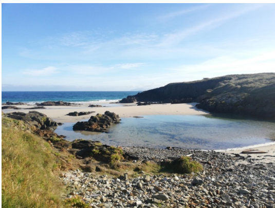
PRAIA DE MARMADEIRO