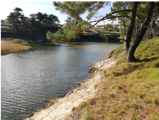
DESEMBOCADURA DO REGO