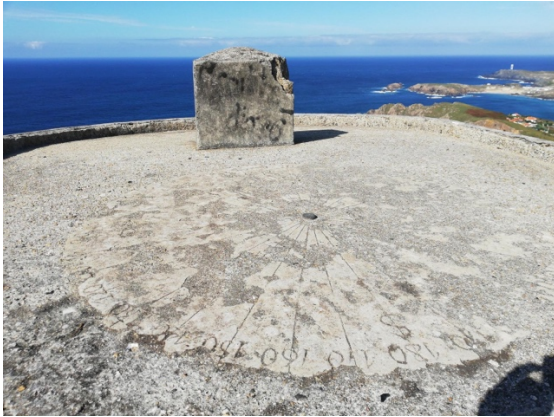
BATERIAS CAMPELO BAIXO.