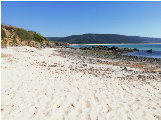
PRAIA DO VILAR

Dejando atrás el pequeño núcleo de población perteneciente a Covas, comenzamos una suave y larga subida hacia Cabo Prior. La ruta continúa por un sendero de tierra, que, aunque no es el más próximo al mar, va tomando altura y nos permite disfrutar del magnífico paisaje que queda a nuestras espaldas, las vistas son impresionantes.