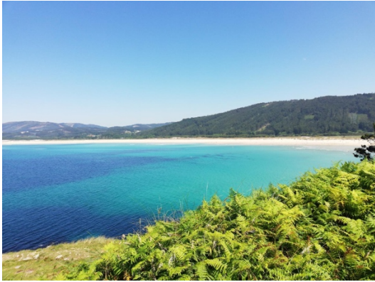
PRAIA DE SAN XURXO